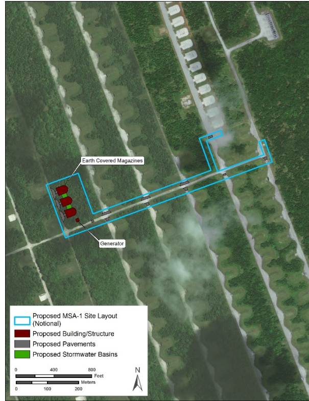
Figuran 3: I Ma Proponi na Fina'maolek Kinalamten gi i MSA-1