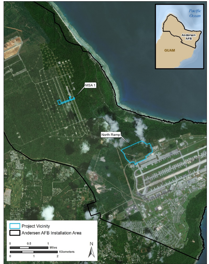
Figuran 1: Estague' Siha na Lugät Man Ma Ayek para Fina'maolek Kinalamten gi i Andersen AFB

I tinattiyin areklamenton NEPA, 'public scoping' i aktibidät ni täftäf yan ma baba, ya para u identifika i problema siha yan otro siha na kosas ni para u ma atende gi EIS ya ma ditetmina häyi (put ehemplo: i pupbliku yan i ahensian gobietnamento siha) man interesao. Gi 'public scoping process', todu ni man interesao siempre manrisibi mäs infotmasion yan siña lökkue' man ma nä'i sinangan gi i ma proponi na aksion, otro siha, yan inafekta siha ni man posipble. I sinangan siha ni ma risibi gi i duränten i 'public scoping process' man ma kunsidera gi i fina'tinas i Draft na EIS. Atani i 'timeline' gi santatten este na plegu para mäs infotmasion put i EIS na kinalamten.